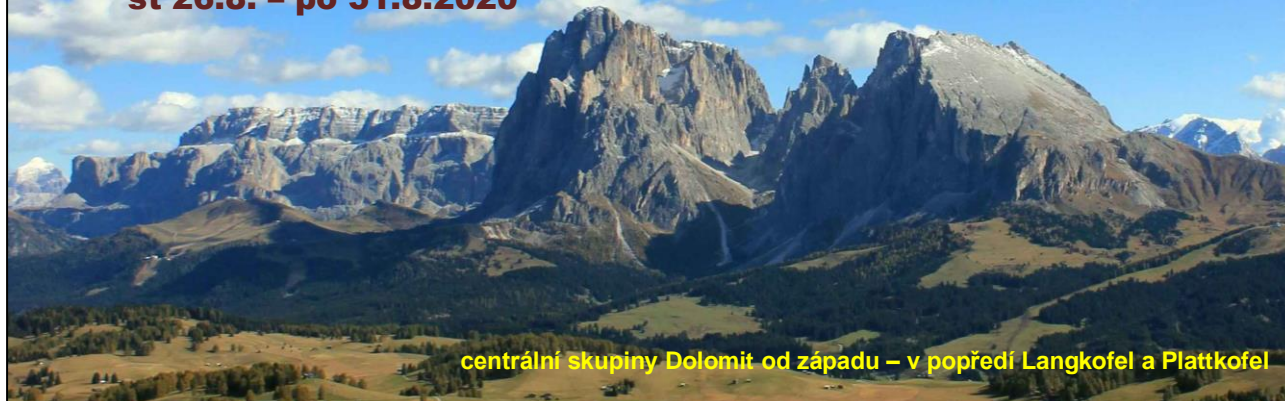
centrální skupiny Dolomit od západu – v popředí Langkofel a Plattkofel

Na nový tematický zájezd zveme všechny milovníky horské flóry do oblíbených Dolomit, letos je pestrý program rozložený zejména v severních a centrálních Dolomitech, 1 den strávíme též v Zillertalských Alpách.